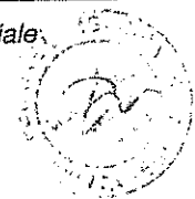
Tabella B3 bis – rifiuti in ingresso autorizzati presso la Piattaforma Ecologica Provinciale