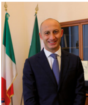
Mauro Gattinoni Sindaco di Lecco