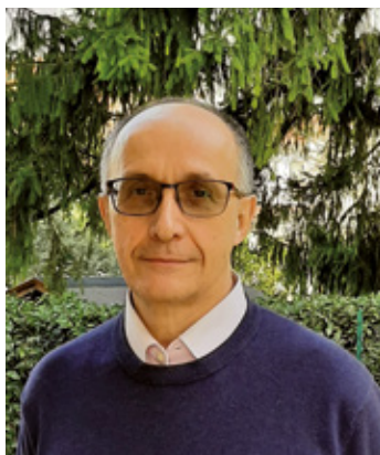
Flavio Polano Sindaco di Malgrate