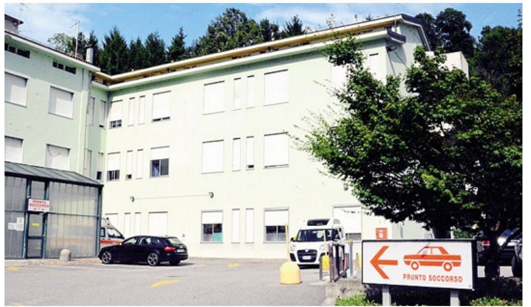
L'ospedale di San Giovanni Bianco