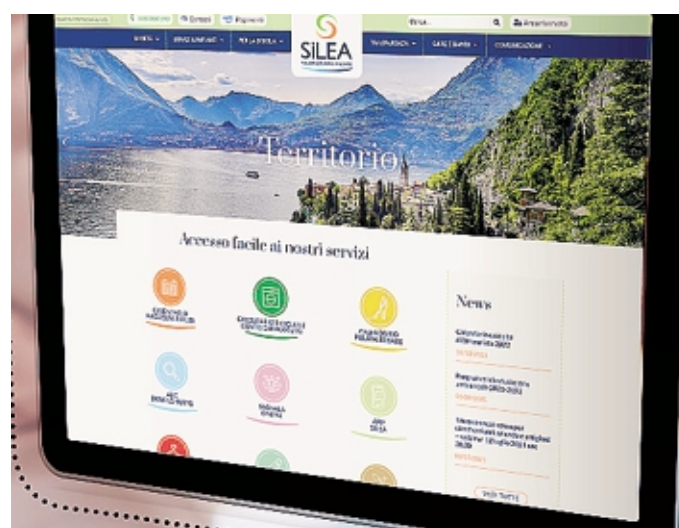
Il sito internet di Silea ospita anche il calendario della raccolta

corgimenti quotidiani: perché l'economia circolare è un obiettivo che si raggiunge passo dopo passo. Se hai dubbi, domande o richieste di chiarimento manda una mail a educazioneambientale@laprovincia.it