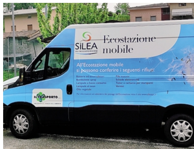
L'ecostazione mobile di Silea

tro di raccolta si avvicina ai cittadini, che hanno così a disposizione un ulteriore comodo punto di ritiro nel proprio paese o nel proprio quartiere senza dover necessariamente utilizzare l'auto per raggiungere la ricicleria. Per conoscere giorni, orari e punti di fermata del furgone è possibile consultare il sito web di Silea alla pagina dedicata ( www.sileaspa.it/raccolte-differenziate/ecostazione-mobile/ ) o la App Silea.